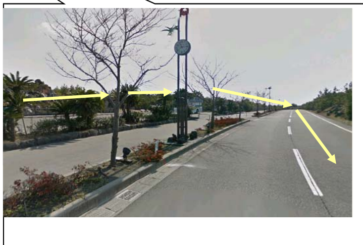
「別図1」第1ステージ折り返し付近図 烏島展望所